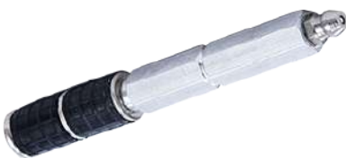
หัวแพคเกอร์ Injection Packer