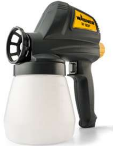
ปืนพ่นสีไร้อากาศ W180P W180P Airless Spray Gun