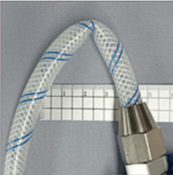
ข้อต่อที่ไม่ได้ติดสปริงอาจเกิดเหตุการณ์แบบนี้ Fitting which is not installed the hose guide may happen case like above.