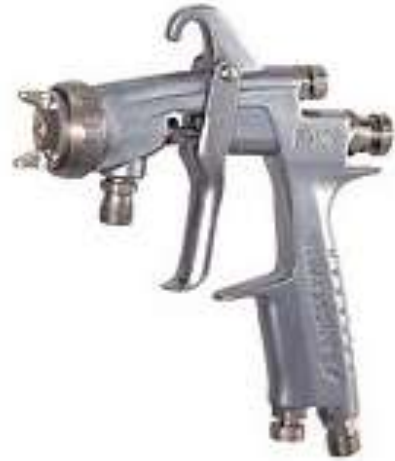
W-101 ที่เลิกผลิตแล้ว W-101 is discontinued status