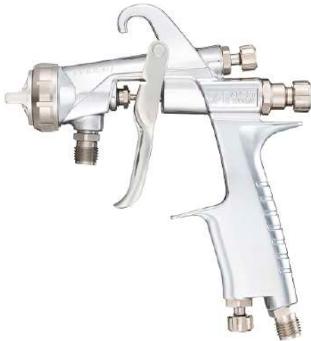
WIDER 1 รุ่นที่มาแทน WIDER 1 the successor product

คุณภาพที่ต่อยอดจากรุ่นก่อน ให้ดีกว่าเดิมโดยไม่ทิ้งจิตวิญญาณของ ANEST IWATA The quality which is developed from prior generation without leaving the spirit of ANEST IWATA