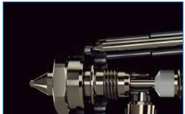
ตำแหน่งการปรับม่านสี Position of Pattern Adjustment

The previous pattern adjustment set reached around 45% of full pattern width with 1 turn, around 80% with 1.5 turns and almost 100% or nearly fully open with 2 turns. Our newly-developed pattern adjustment set now provides around 35% with 1 turn, around 50% with 1.5 turns, and around 70% with 2 turns. This linear response to adjustment is intuitively easier to operate.